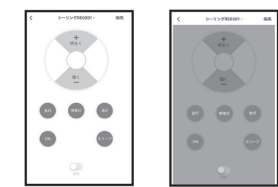
⑦照明器具のリモコン画面がハイライト表示されるようになり、照明器具の点灯/消灯状態をリモコン画面で確認することができます。