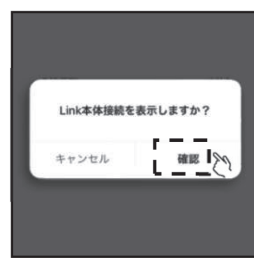
⑤「Link本体接続を表示しますか?」の画面で「確認」をタップします。