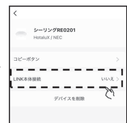
④「LINK本体接続」をタップします。 (初期設定ではLINK本体接続が「いいえ」に設定されています。)