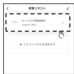
②本製品に取付けた照明器具のリモコンをタップします。