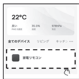
①ホームの「家電リモコン」のアイコンをタップします。